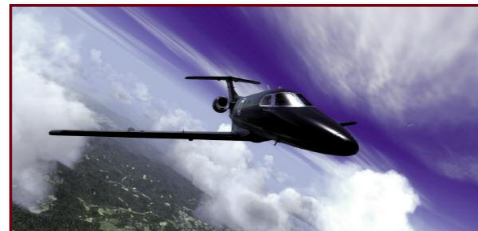
Les caméras extérieures ont les angles habituels chez Carenado, toutes ne mettent pas aussi bien en valeur la réalisation.

conventionnels – attention, le Phenom, comme dans la réalité, n'a pas de radiocompas. Sans être équipé d'automanettes, le Phenom peut, grâce à la fonction FLC de son pilote automatique, maintenir une vitesse donnée en montée ou en descente vers l'altitude sélectionnée, en travaillant sur l'assiette. C'est une fonction du couple G1000/GFC700 qui équipe le Phenom et pas mal d'autres appareils légers. Plutôt qu'implémenter à l'aide de DLL sophistiquées cette possibilité, Carenado a utilisé celles du mode automanettes de FS, ce qui lui a été reproché par les puristes, mais était aussi le cas dans la version Wilco, et ne gêne en rien l'immersion. Il est vrai qu'avant l'application du service pack, le Phenom pouvait connaître des phénomènes d'oscillation en assiette exagérés si le mode était enclenché avec une vitesse mal ou pas programmée.