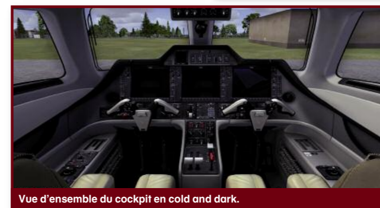
Vue d'ensemble du cockpit en cold and dark.