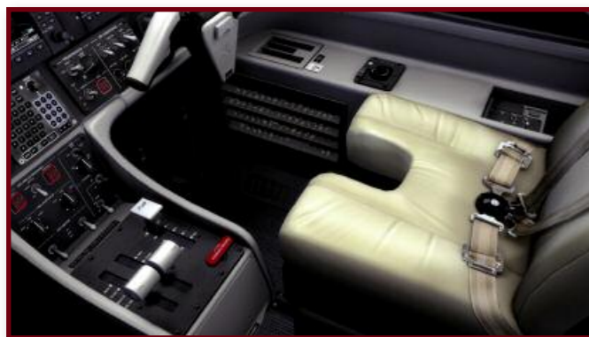
Ci-dessus (de gauche à droite) :