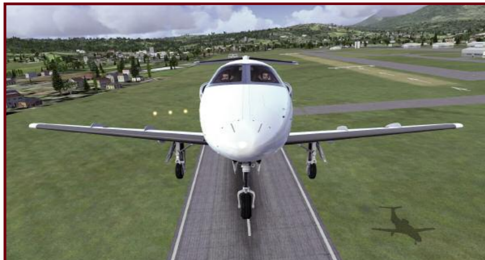
Faites en sorte de rester dans l'axe en région montagneuse, le TAWS est susceptible.

se contente de lister ses fonctions sans même, le plus souvent, indiquer comment y accéder... Vous pouvez trouver la version officielle sur le site de Garmin ( static.garmincdn.com/pumac/190-00728-04_0A_Web.pdf ).