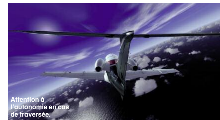
Attention à l'autonomie en cas de traversée.

bien s'élaner dans les airs, même s'il dévore le kilomètre de piste à sa disposition. Le train rentre en douceur, on ne l'entend ni ne le sent, ce qui est peut-être un peu exagéré même si le cockpit est bien insonorisé. La sonde sol (le TAWS) n'apprécie que modérément la présence de montagnes autour du terrain et avertit avec énergie en cas de proximité ou d'assiette de montée insuffisante. L'inclinaison nulle demande de la précision pour être tenue, c'est le moment d'examiner les trims. Tous sont électriques, avec un compensateur de lacet, un