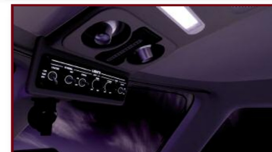
Réglages des éclairages à la tombée de la nuit.

Plus généralement, il n'est pas facile d'apprivoiser les systèmes du Phenom lorsqu'on sort de plusieurs heures de liner car, si le même objectif d'automatisation est poursuivi, la logique d'utilisation est très différente. Embraer met en avant la simplicité d'utilisation du G1000, mais le simmer accoutumé aux systèmes de l'A320 risque de