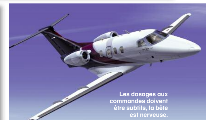
Les dosages aux commandes doivent être subtils, la bête est nerveuse.