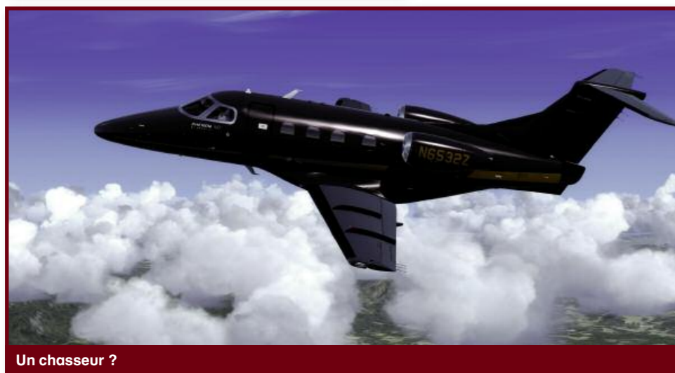
Un chasseur ?