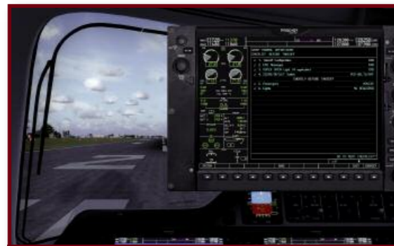
Un petit coup de check-list avant le décollage ne sera pas inutile...

Les ressemblances entre les deux rivaux ne s'arrêtent pas à l'extérieur. Tous deux disposent d'un glass-cockpit organisé autour du Garmin G1000, avec de grands écrans très agréables à l'usage. Mais Embraer a choisi une version personnalisée et plus riche en systèmes de vol, sous la marque Prodigy FlightDeck 100, qui est représentée en détail dans l'addon. Préférez un manuel de Prodigy réel, plus complet sur le mode opératoire, que celui de Carenado qui