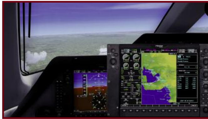
Ci-dessus (de gauche à droite) :