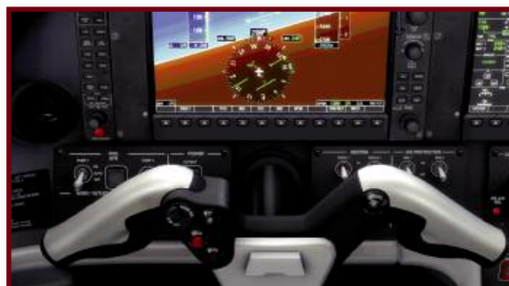
Le compensateur de profondeur et le PA sont accessibles sur le yoke.

de roulis et un de tangage. Ce dernier est relayé au manche par deux boutons (vers le bas et vers le haut). Un indicateur de position aurait aidé à leur réglage, mais ce n'est pas de la faute de Carenado s'il n'existe pas, c'est aussi le cas dans le Phenom réel. Heureusement, les étiquettes légendées donnent la valeur de correction. Attention à leurs réglages, l'avion ayant une tendance marquée à partir en oscillation lorsqu'il est mal compensé.